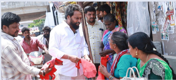
తాడేపల్లి, రక్షణ స్టాఫ్:

ప్రపంచ పర్యావరణ దినోత్సవం సందర్భంగా గుడ్డ సంచుల పంపిణీ